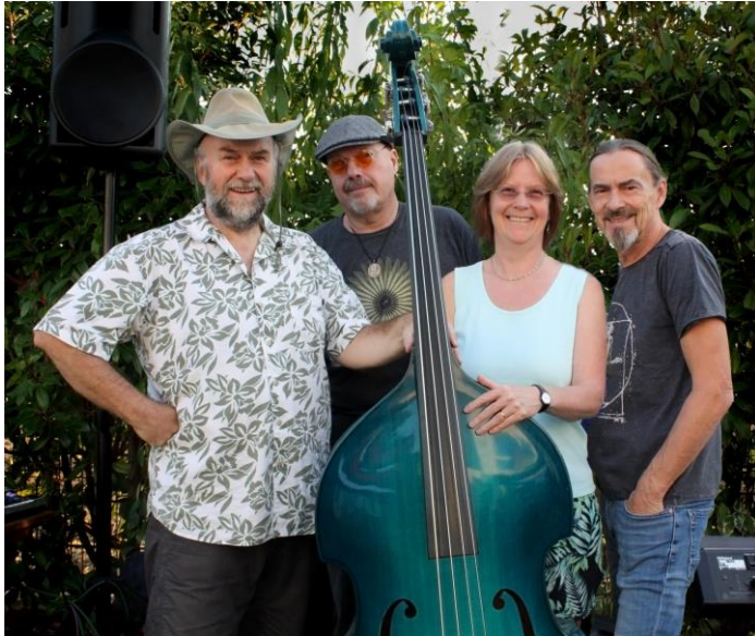
Die Band „Toms & Jerries“