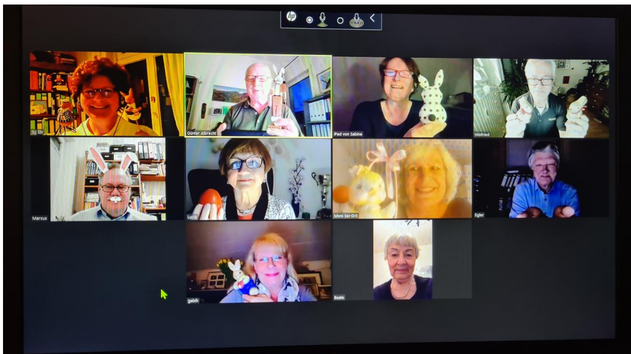
Der Vorstand bei seiner online Vorstandssitzung am 24.03.2021 mit seinen speziellen Osteraccessoires