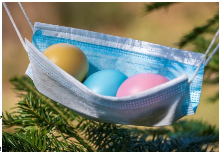
Das etwas andere Osterkörbchen